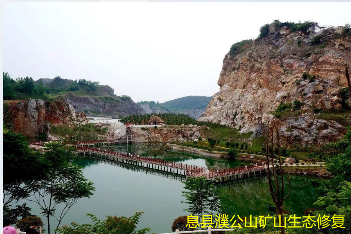
息县濮公山矿山生态修复

对于合理削坡减荷、消除地质灾害隐患等新产生的土石料及原地遗留的土石料等无偿用于本修复工程，如有剩余的，县级以上人民政府依托公共资源交易平台体系处置，收入优先保障投资主体合理收益，多余部分由当地县级政府统筹用于当地生态修复。